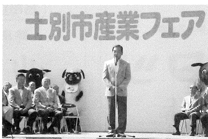
開会式 千葉会頭挨拶

「産業フェア」 多くの市民で賑わう 士別市産業フェアが八月三十日、中央公園で開催されました。 当日会場には農産物や牛・羊肉等の購入を目的に、沢山の家族連れで賑わいを魅せ好天のなか年一度のイベントを楽しんでいました。