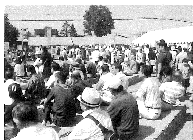
賑わいを魅せる会場